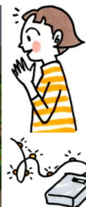
電池式LEDワイヤーライト