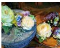
you & me U~chan*mint （アーティフィシャルフラワー）