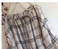
atelier Kei （リネンのお洋服）