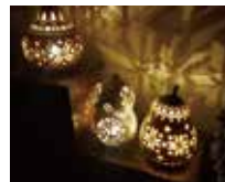
Mimi* （ひょうたんランプ）