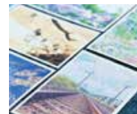
Maki..Happy Photo （ポストカード）