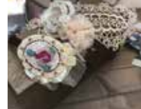
nanohana*haru （ヘアアクセサリー）