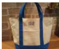
you & me asari （帆布バッグ）