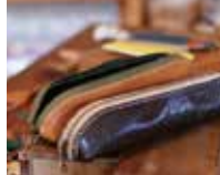
teku teku （革小物）