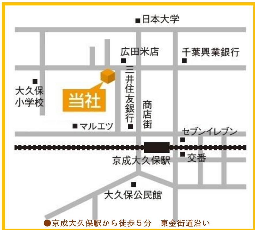
●京成大久保駅から徒歩5分 東金街道沿い

恐れ入りますが、駐車スペースがございませんので、お車でご来場はお控え いただくか、最寄りのコインパーキングのご利用をお願い致します。